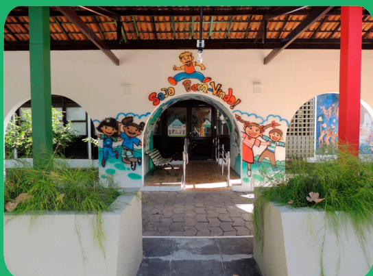
A equipe da Creche Paulo VI está trabalhando para receber os alunos tão logo seja possível

A iniciativa, além de auxiliar familiares neste momento de pandemia, visa assegurar a qualidade do serviço da instituição (mesmo a distância) e preservar o futuro da escola. A mensalidade passa a ser cobrada integralmente conforme o valor acordado tão logo as aulas sejam retomadas.