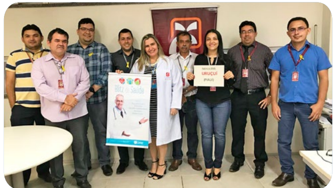
Funcionários das agências de São João dos Patos (MA) e de Uruçuí (PI) atendidos durante mais uma edição da Blitz da Saúde.