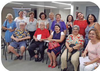
Participantes do grupo "Pais Idosos, Família Presente"